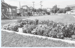
◀ロイヤル鳴滝町会 「さくらの会」