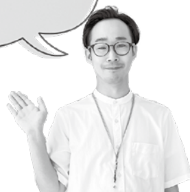
保健予防課 精神保健福祉士