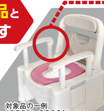
対象品の一例 1996年~2002年に販売