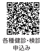
各種健診・検診申込み