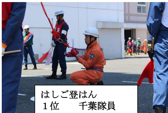
はしご登はん 1位 千葉隊員