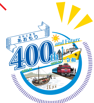
他の要素を加える