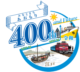
指定フォント以外の使用