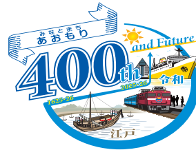
形状の変更・加工