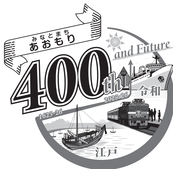
和文バージョン (グレースケール)