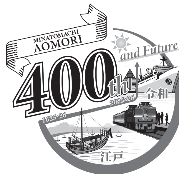
英文バージョン (グレースケール)