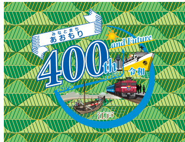
視認性を損なう 背景への配置