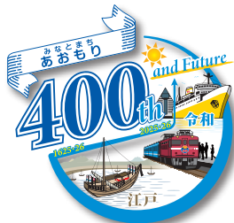
シャドーを加える