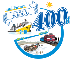
レイアウトの変更