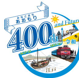
クリアスペースを無視した配置