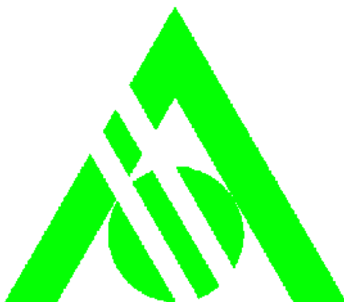
青森市交通安全シンボルマーク