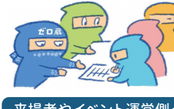
来場者やイベント運営側・ 出店者の行動管理