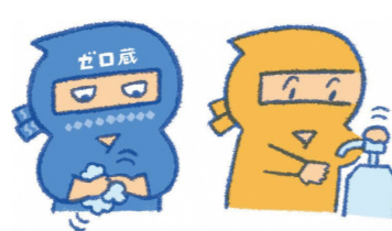
手洗・消毒の徹底