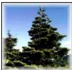
市の木 【あもりとどまつ】