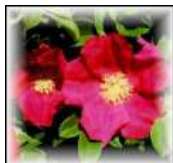
市の花 【はまなすの花】