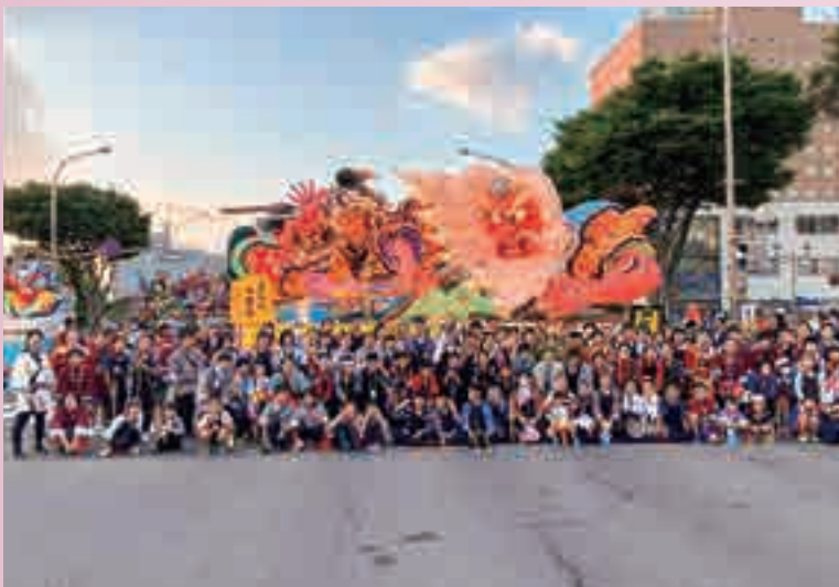
市内全域から子どもたちが集まり、さあ出陣だ！

昨夏「児童参加が500人未満なら撤退」と背水の陣を敷いた青森市PTA連合会。現役・OB・OGが一丸となって運営に取り組み、初日から505人と目標を達成、期間中の延べ人数は1241人と目標の2倍になりました。撤退の危機を乗り越え、運行継続に向けて動き出した市P連に、子どもたちへの思いを伺いました。