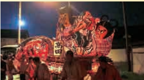
今夏運行した青森市高田地区の地域ねぶた荒川、横内、幸畑地区の有志も参加しました