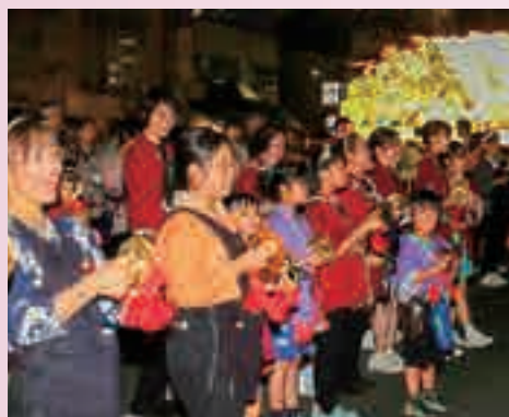
子どもも大人も笑顔で、はやしを奏でます

人口減少で児童数も減る中、様々な場面で「やめる」という動きが出てきています。しかし、ねぶたを残すか、なく