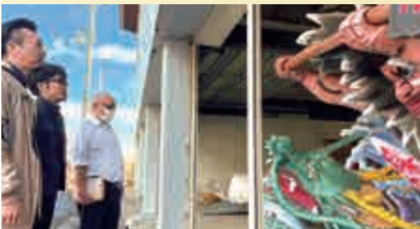
青森市が貸し出す予定のねぶたを下見

今夏はねぶた運行の情報を集め、それを分析して運行マニュアルを作ります。いつか未来の若者が「ねぶたを復活させたい」と思ったときに役に立てばと、今から動いているところです。