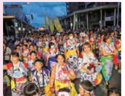
「ラッセラー」と元気な声を響かせました

今年は子どもたちの思いを形にしようと、大型ねぶたの原画と題材を市内の小中学生から募りました。能登半島地震被災地への思いが込められた「龍神と大鯰」で出陣します。