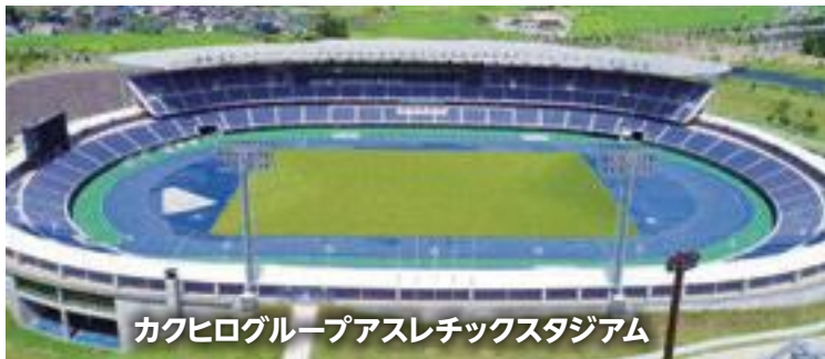
カクヒログループアスレチックスタジアム

国民スポーツ大会(略称:国スポ)は、毎年都道府県持ち回りで開催される国内最大のスポーツの祭典です。令和6年から、国民体育大会から「国民スポーツ大会」へと名称が変わりました。正式競技は、競技得点の合計を競う都道府県対抗形式で行われ、天皇杯(男女総合優勝)と皇后杯(女子総合優勝)を巡る熱戦が繰り広げられます。競技得点の対象になる「正式競技」のほか、子どもから高齢のかたまで気軽に参加できるスポーツイベント「デモンストレーションスポーツ」(略称:テモスポ)などの競技を実施します。青森県での国スポ開催は、昭和52年(1977年)の第32回国民体育大会(あすなろ国体)以来、49年ぶりです。