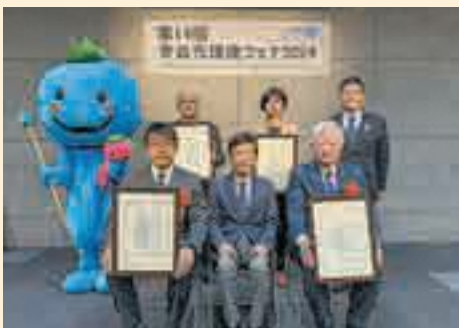
令和6年度受賞団体の皆さん

12月15日、第14回青森市環境フェア2024において、表彰式が行われました。本表彰は、青森市の豊かな環境の保全に貢献している団体を表彰し、その活動を広く市民の皆さんへ紹介することで、環境に対する意識向上及び環境に配慮した活動を推進するものです。受賞団体の皆さん、おめでとうございます!