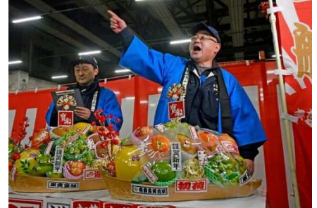
画像は、本年1月5日の初せり式