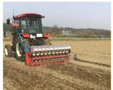
▲乾田直播作業の様子

青森市では、今後更に普及が見込まれる情報通信技術(ICT)を活用したスマート農業技術の普及を支援するため、市内2ヶ所に RTK-GNSS 基地局を設置しました。当基地局の高精度測位技術を活用したトラクター作業の実演会を実施することにより、農業者のスマート農業機械の導入意欲の向上を図ります。