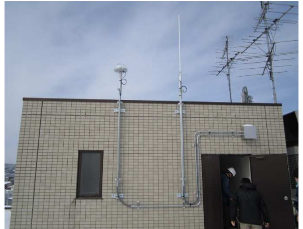
▲青森市 RTK-GNSS 基地局 (荒川市民センター)