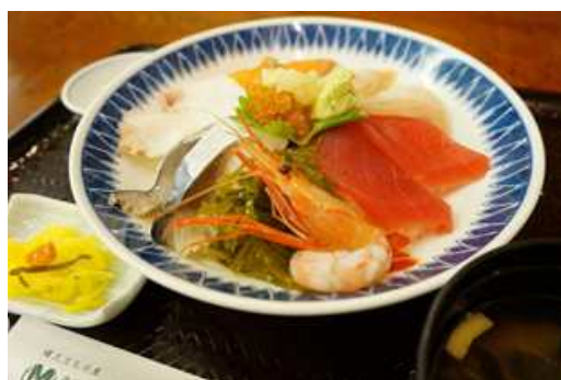
海鮮丼（ひろめ荘）イメージ