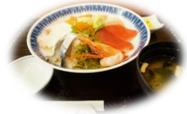
(昼食イメージ・ひろめ荘提供)

ご旅行条件書【要約】お申込みの際、必ず「国内募集型企画旅行条件書」を別途お受け取り頂き、ご確認の上、お申込みください。