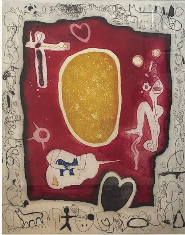
「散歩」山内ゆり子 [ エッチング・アクアチント ] 1990