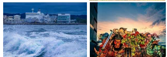
(令和4年度 青森市民の受賞作品)