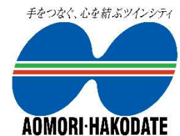
(青函ツインシティ シンボルマーク)

3 応募方法 : 右の応募フォームに必要事項(氏名や写真のエピソード等)を記入し、写真データを提出