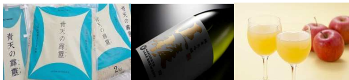
(副賞: 特産品イメージ)