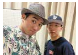
ラジオ体操 最高責任者