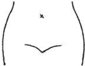
(ストマ及びびらんの部位等を図示)