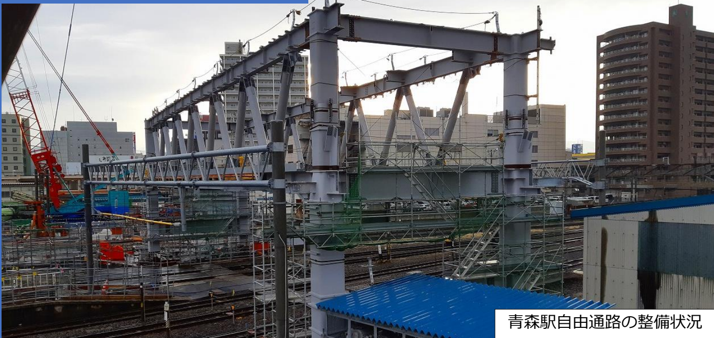
青森駅自由通路の整備状況