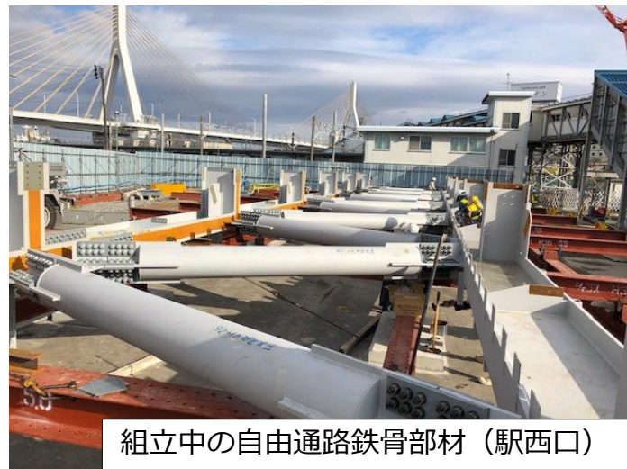
組立中の自由通路鉄骨部材（駅西口）