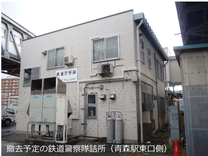
撤去予定の鉄道警察隊詰所（青森駅東口側）

1月は工事用ヤードの整備として、重機車両のための進入路の整備や、 移転する鉄道警察隊詰所の新築工事を進めております。