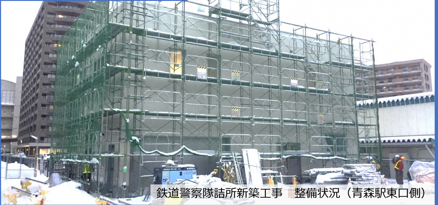
鉄道警察隊詰所新築工事 整備状況（青森駅東口側）