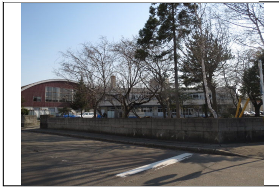
③から撮影した写真