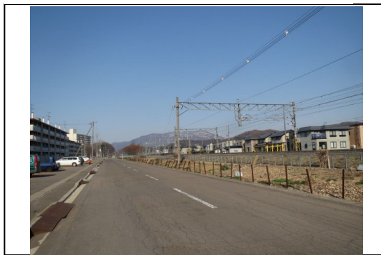
⑪から撮影した写真