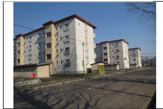
⑥から撮影した写真