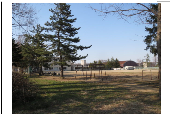
⑨から撮影した写真