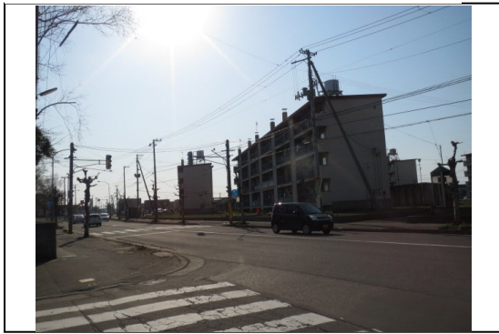
①から撮影した写真