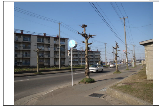
④から撮影した写真