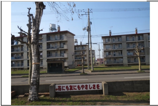
②から撮影した写真