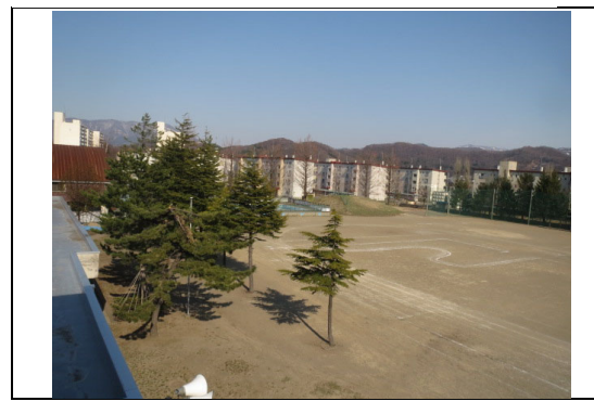
⑧から撮影した写真