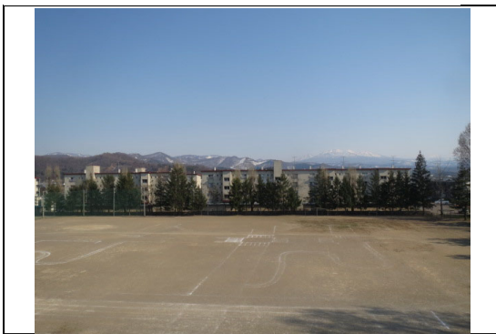
⑩から撮影した写真