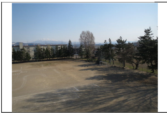
⑦から撮影した写真