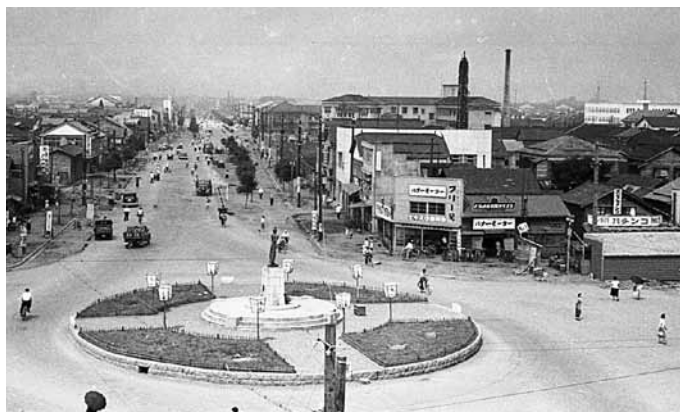
昭和30年頃の柳町ロータリー