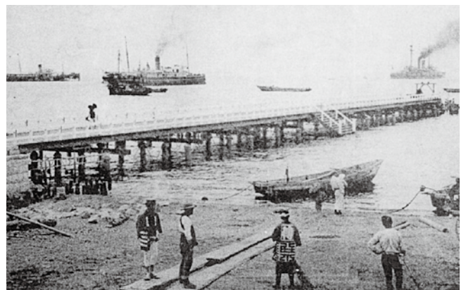
明治40年頃の安方棧橋（青森県史編さん資料）