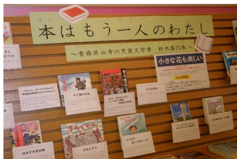
展示の様子（児童ライブラリー）

展示は、今回ご協力をいただいた青森県近代文学館作成のパネルと、青森市民図書館に所蔵されている関連図書からなるもので、展示した本は貸出も行いました。