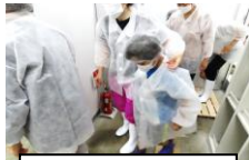
長靴に履き替える