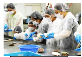
ほたて貝むき体験