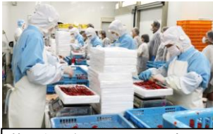
筋子を発泡スチロールに詰める