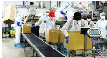
段ボールに半成員を詰める

靴底を消毒してから工場内に入場し、工場責任者から加工場の仕事内容の説明を受けました。