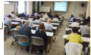
熱心に講義を聴く参加者

参加者からは「分かりやすく参考になった」「資料を自宅で読もうと思う」「内容が具体的でレジュメが良かった」「成年後見制度の内容をもう少し詳しく説明してほしい」「事例があるととっても良かった」等の感想を頂きました。