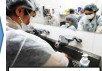
手をきれいに洗う