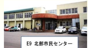
E9 北部市民センター

いまだ大変な時期ですが、皆様が当センターを楽しくご利用して頂けるよう職員一同心しておまちしております。