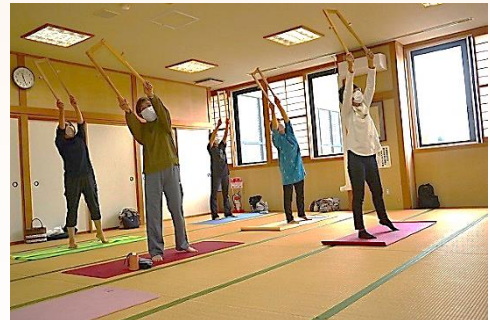
からだバーを使ってストレッチ

例えば、ラジオ体操での動作の一つに、からだバーを持つことによって、誰でもしっかりと伸びる動作をすることができます。からだバーを使って「筋力、バランス、コーディネーション、ストレッチ、ほぐし」の「5つの要素」を効果的にエクササイズできるというわけです。「からだバー」は、どこでも販売しているというものではありませんが、インターネット通販で「DVD付き（トレーニング方法説明）」で購入可能でした。