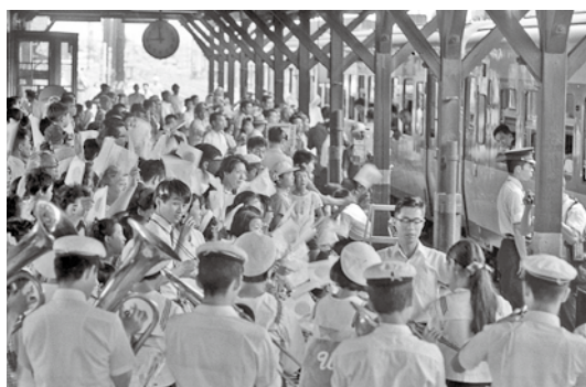
【写真①】営業最終日の浦町駅 (昭和43年7月21日)

今年度、青森市民図書館は開館40周年を迎えましたが、青森市における公立図書館の歴史は明治時代まで遡ることができません。青森市に公立図書館が初めて設置されたのは明治40年（一九