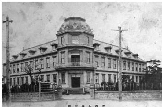
【写真④】浦町にあった青森大林区署 (明治30年代)

「観光通り」の歴史は、明治35年（一九〇二）に鍛冶町（現本町）から浦町へ通じる新道が建設されたことによつて始まります。しかし翌年、この新道のつき当たり（現青森商工会議所付近）に青森大林区署（青森営林局の前身）の庁舎が北を向いて建設され【写真④】、新道は南へ伸びることができない状態となりました。 ところが、明治40年に青森大林区署の庁舎が火災で焼失し、沖館（現青森市森林博物館）へと移転することが決まりました。大林区署の跡地は東西二つの区画に分けられ、中央に道路が通されました。さらに、明治43年には東北線の線路（現旧線路通り）を越えたところに青森高等小学校（現浦町小学校）が建設され、通りは学校付近まで延びました。 その後、学校の南方では大正12年（一九二三）から青森操車場の建設が進められ、大正15年に完成しました。操車場とは貨物列車の貨車を目的地別に仕分け、組み替えるための施設で、青森駅において増加する貨物の取扱いに対応するために建設されました。その跡地が青い森セントラルパークになっていることはご存じのかたも多いでしょう。 この時、操車場の建設予定地内にあった火葬場が操車場南方の筒井村へ移転することとなり、通りは火葬場へ通じる道として、さらに南へと延びていきました。 そして戦後、通りは横内方面へと延びていきました。この道は八甲田観光の新ルートとして期待されるようになる