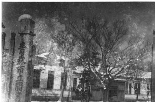
【写真②】大野村にあった青森市立図書館 (大正時代)

決まり、大正4年、大野村に青森市立図書館が置かれました【写真②】。 さらに、大正14年には図書館を橋本へ移転し、跡地に古川尋常高等小学校（現古川小学校）を建設することが決まりました。当時、青森市では児童数の増加により学校不足が問題となっており、学校の新設が必要な状況だったのです。この学校は大正15年に開校し、青森市の子どもたちが大野村へ通学することになりました。なお、この時建設された校舎は昭和20年（一九四五）7月28日の空襲で罹災しますが、鉄筋部分は残り、平成8年（一九九六）まで使われました【写真③】。