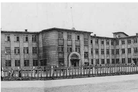
【写真③】古川小学校 (昭和20年代・歴史資料室蔵)

決まり、大正4年、大野村に青森市立図書館が置かれました【写真②】。 さらに、大正14年には図書館を橋本へ移転し、跡地に古川尋常高等小学校（現古川小学校）を建設することが決まりました。当時、青森市では児童数の増加により学校不足が問題となっており、学校の新設が必要な状況だったのです。この学校は大正15年に開校し、青森市の子どもたちが大野村へ通学することになりました。なお、この時建設された校舎は昭和20年（一九四五）7月28日の空襲で罹災しますが、鉄筋部分は残り、平成8年（一九九六）まで使われました【写真③】。